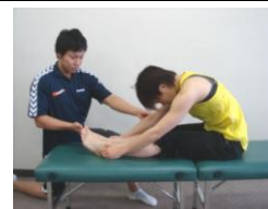
柔軟性のチェック