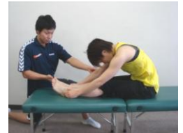
柔軟性のチェック

習得.4 改善に必要なコンディショニングテクニックを実技と理論で解説していきます